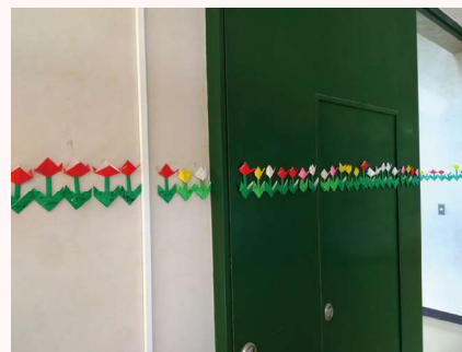
この高さまで津波が

これらの取組について、自ら振り返り、発信する活動を継続することにより、子どもたちには、「命を守る」「支え合って生きる」につながる判断力と行動力がついてきました。それが、ふだんの学習や生活の