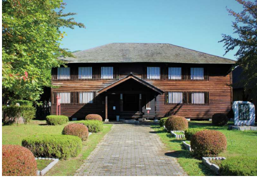
旧浪民尋常小学校