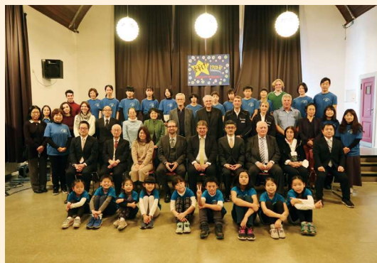
最大の行事学校祭

ことは、かけがえのない思い出となりました。日本人学校では、ベルリンでしかできない素晴らしい体験がたくさんありました。子どもたちの感受性、視野、考えを広げる多くの活動は、私にとっても大変刺激的でした。ベルリンでの経験は、これからもどんなことにも挑戦し続けていこうという、私の人生の糧となっています。