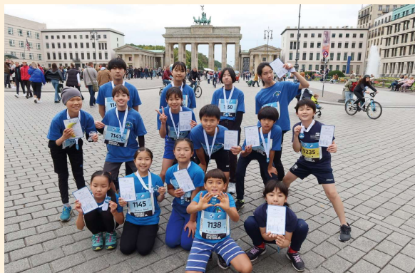
ベルリンミニマラソン

2つ目は、ベルリンミニマラソンです。ベルリンマラソンと同じ最後の4.2キロのコースを走る貴重な経験です。朝会や体育の授業を使って、夏休み明けから練習を重ね、大会当日、ブランデンブルク門を抜けてゴールしたさわやかな子どもたちの笑顔は、達成感に満ち溢れていました。また、私自身ベルリンマラソンに挑戦し、子ども達、保護者に応援されながら完走した