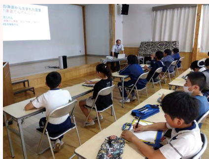
地域の方から学ぶ防災教室

なっている本校ですが、東日本大震災では、津波により、校舎1階が浸水するなどの大きな被害に遭いました。それ以来、本校では、「命を守る」「支え合って生きる」を大きな柱の一つとして、防災教育に力を入れています。