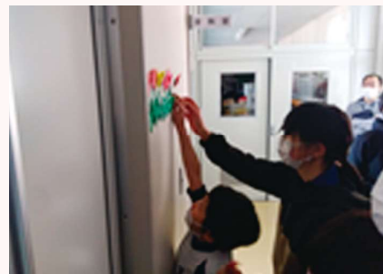
作ったチューリップを6年生と一っしょに貼る1年生